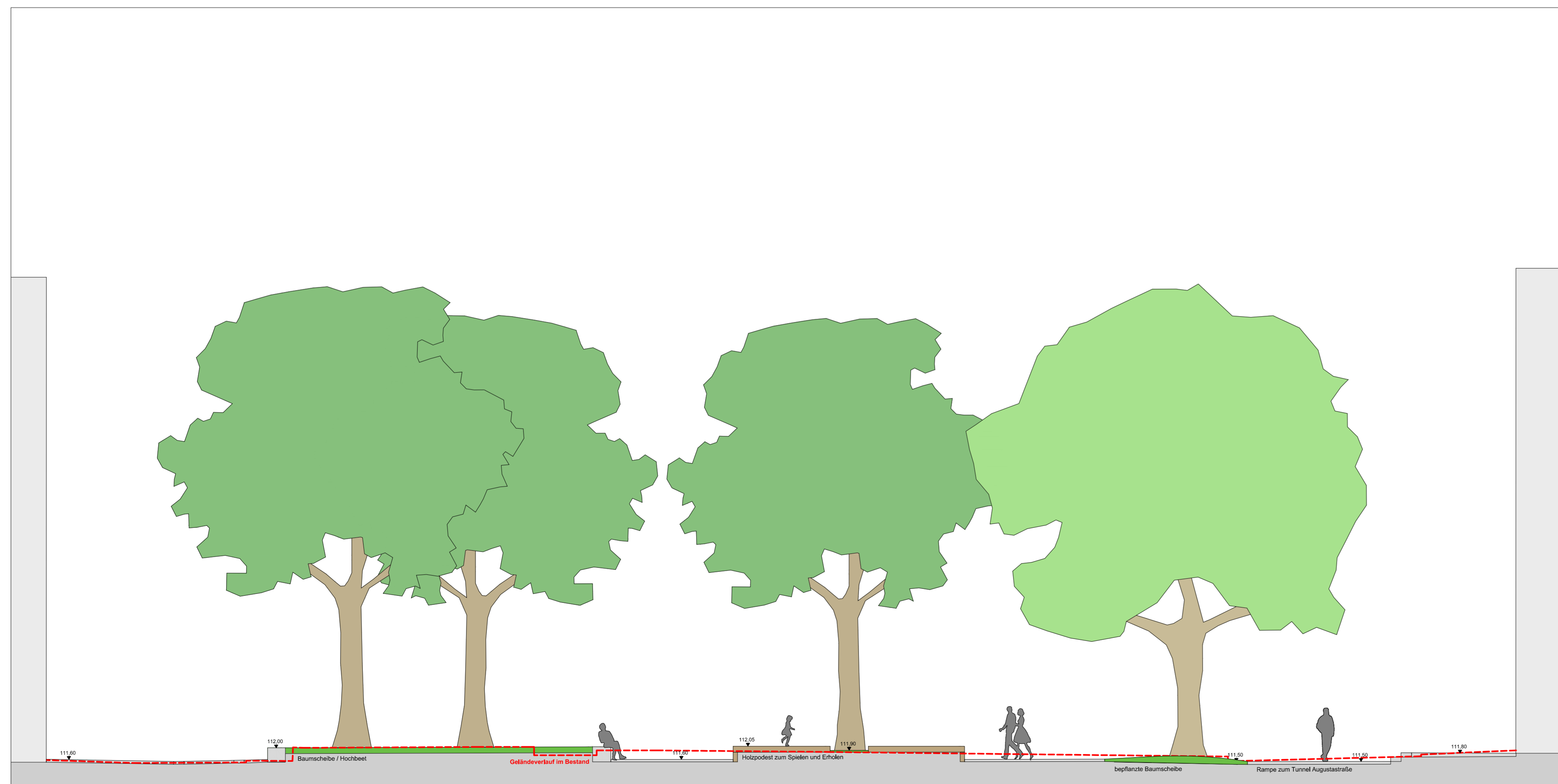
Schnitt B-B' 1:100